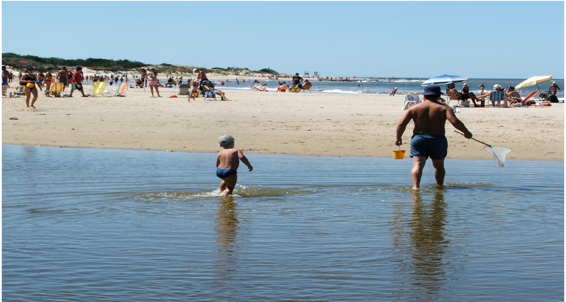
Directrices Microrregionales de Ordenamiento Territorial de Costa de oro Secretaria de planificación – Intendencia de Canelones